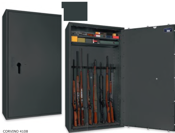
CORVINO 4108 Graphitgrau • graphite grey Dekoration nicht im Lieferumfang enthalten • decoration not included in the delivery

Waffenschrank, Grad I (EN 1143-1) Weapon safe, Grade I (EN 1143-1)